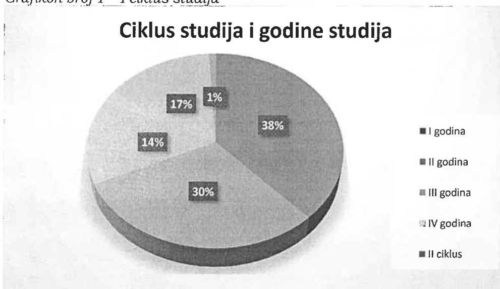
Grafikon broj 1 – I ciklus studija

Od ukupnog broja upitnika, 405 (61 %) je ispunjeno za i nastavnike/ce, od čega 49 upitnika na izbornim predmetima na II, III i IV godini studija.