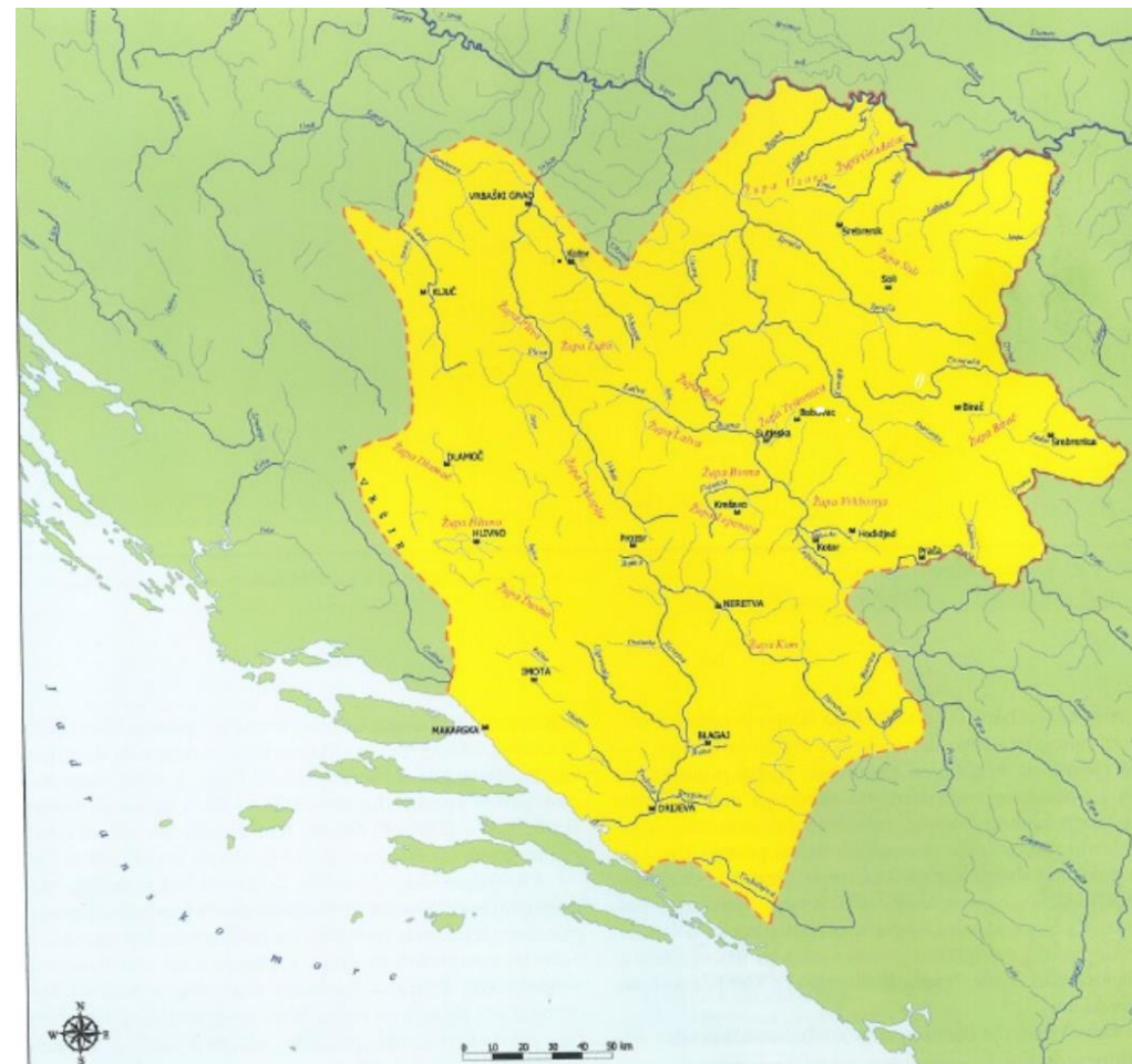
Bosna za vrijeme Stjepana II Kotromanića